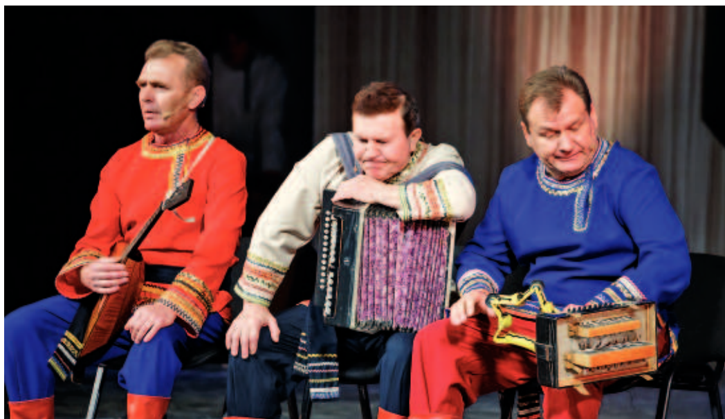
Ансамбль «Мужики» – истинно народные музыканты