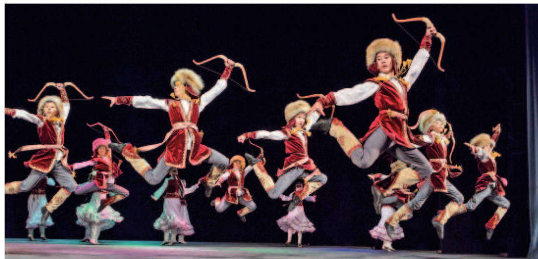
«Далан» в переводе с башкирского «Удача»

Ансамбль народного танца «Далан» из Кармаскалинского района Башкирии принимает участие в фестивале «Факел» уже в третий раз.