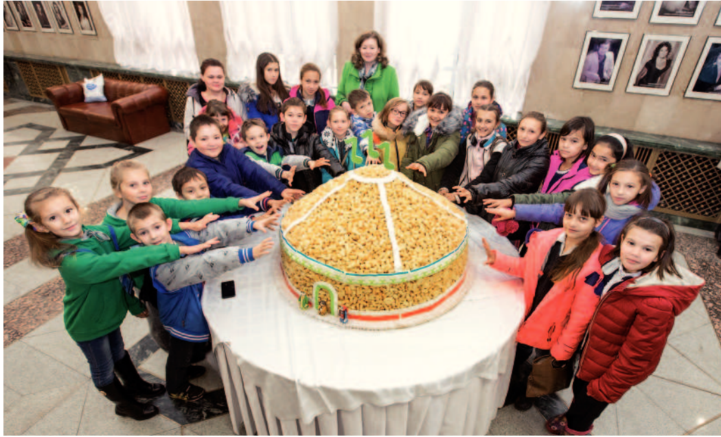
Башкирское лакомство для детворы

В рамках фестиваля «Факел» в Уфе состоялся благотворительный концерт «Дети – детям!», с которого никто не ушел без уникального сладкого подарка.